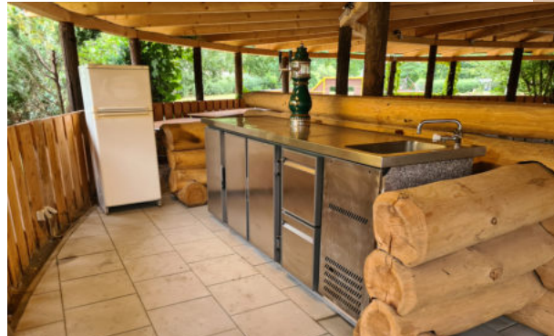
Große Rondell - Platz für 100 Personen mit Tresen zum Getränkékühlen